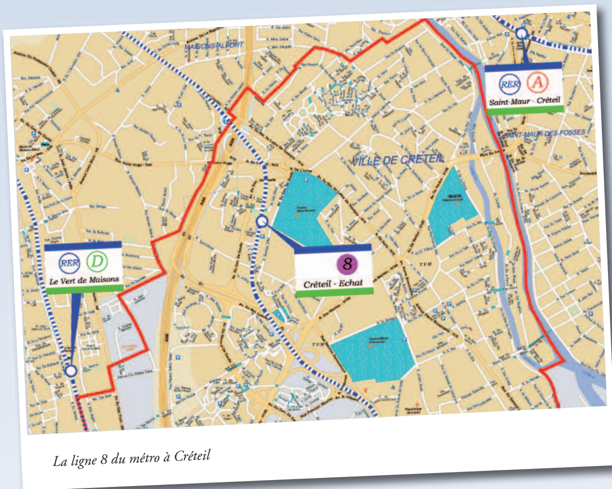
La ligne 8 du métro à Créteil

en commun majeure et indispensable pour une bonne desserte et un bon développement territorial du Sud-est francilien.