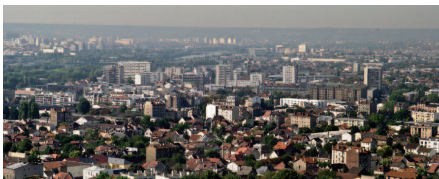
8 km de façade sur la Seine, à 10 km du cœur de Paris et à 5 km de La Défense

Une offre d'habitat et d'emplois qui doit bénéficier de connexions renforcées avec le cœur d'agglomération