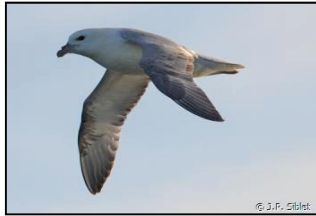
Fulmar boréal

Cinq Zones de Protection Spéciale (ZPS) ont été désignées au titre du réseau Natura 2000 afin de protéger ces espèces. Ces zones sont principalement situées sur les estuaires.