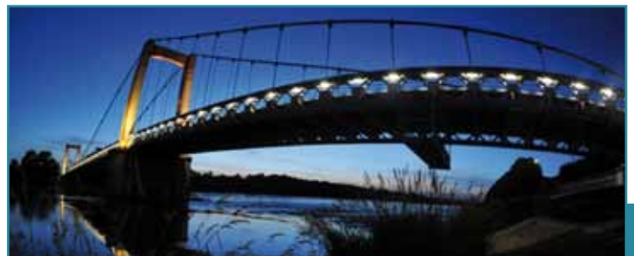
Pont de Cosne Cours sur Loire

Parmi les quatre scénarii retenus par RFF (Ouest, Ouest sud, Médian et Est), la Communauté de Communes Loire & Nohain et les villes qui la composent, dont celle de Cosne-Cours-sur-Loire, souhaitent préciser, à travers ce cahier d'acteur, pourquoi elles soutiennent le tracé Médian avec un décrochement Gien / Cosne / Nevers.