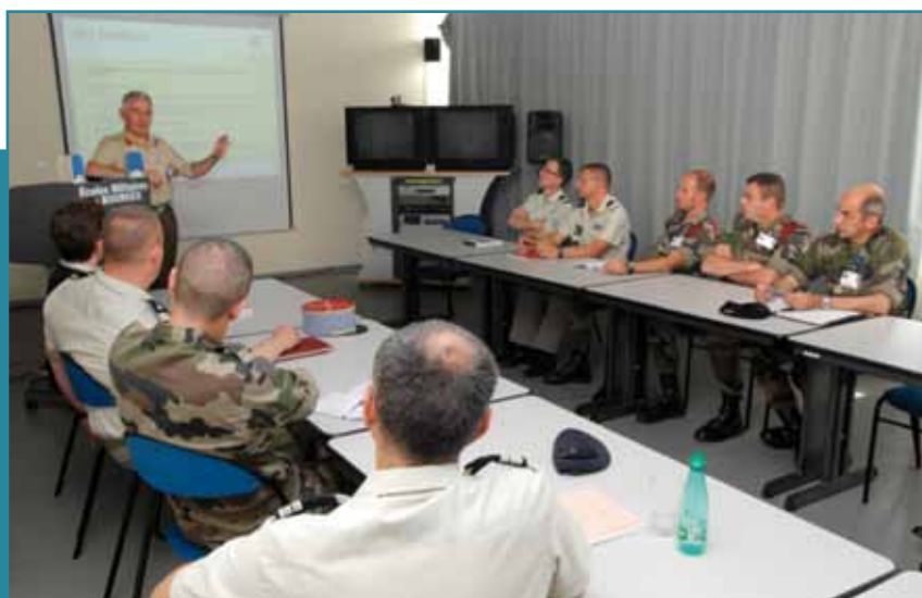
Cours logistique, échange avec l'armée anglaise.

Pour garantir ces formations exigeantes, qualifiantes, en parfaite adéquation avec la réalité d'un monde changeant et les opérations en cours, les écoles militaires de Bourges sont en permanence connectées aux états-majors des grandes villes auxquels elles font appel quotidiennement. Pour l'année 2010, près de 500 conférenciers se sont déplacés à Bourges. Un temps de trajet inférieur à 1 heure (aujourd'hui il faut plus de 2 heures pour rejoindre Paris) permettrait de profiter davantage des compétences des officiers répartis sur le territoire national.