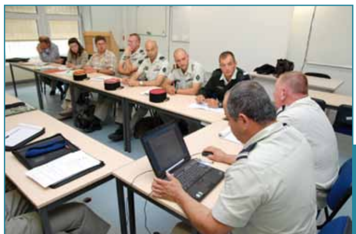
Réunion de travail à Bourges.

Au cours d'une année, les écoles militaires de Bourges parcourent approximativement 90 000 km par voie routière. Ce chiffre serait considérablement réduit si les temps de trajet par voie ferrée étaient diminués et la fréquence des trains augmentée.