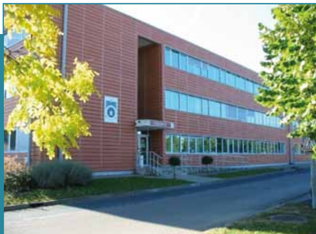
Le CEDIMAT.

Le centre d'études et de développements informatiques du matériel de l'armée de Terre (CEDIMAT) est implanté dans l'emprise des écoles militaires de Bourges. Ses activités couvrent 3 domaines principaux. Le CEDIMAT garantit le fonctionnement du système d'information du maintien en condition opérationnel terrestre. Il assure la conduite de projet des systèmes d'information. A ce titre, il est maître d'œuvre. Enfin, il réalise les évaluations, les études et les expertises techniques des systèmes d'information. Pour remplir sa mission de soutien, le CEDIMAT ne travaille pas seul. Il est subordonné à la structure intégrée du maintien en condition opérationnelle des matériels terrestres (SIMMT), basée à Versailles. En une année, c'est plus de 700 déplacements qui sont réalisés par le CEDIMAT.