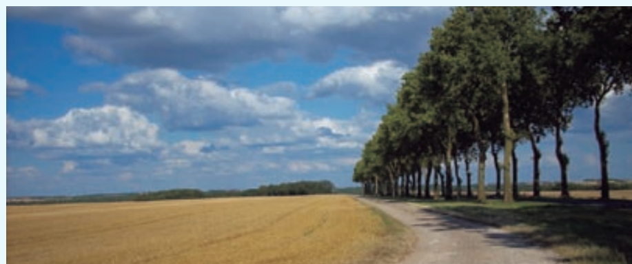
Un cadre de vie recherché

Aussi, il est essentiel que les acteurs du débat public, et tout particulièrement le maître d'ouvrage, tiennent compte des conséquences sur l'activité agricole, avant de privilégier une des solutions proposées.