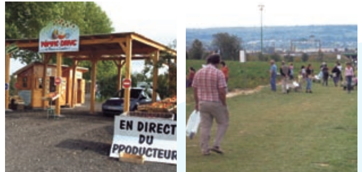
Ventes sur place dans le secteur de la Croix-Verte

Le maître d'ouvrage devrait alors mettre en œuvre des mesures compensatoires importantes pour redonner à ces entreprises les conditions indispensables au maintien et même au développement de leur activité : création d'une « vitrine » commerciale, accès aux lieux de vente, parkings, etc.