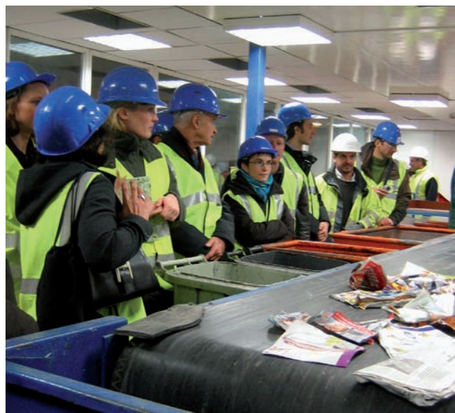
> Centre de tri – visite dans le cadre du Predma

■ Les actions visant à développer la collecte des biodéchets devront être ciblées sur les secteurs les plus pertinents. Si la compétence de collecte ne relève pas du SYCTOM, le syndicat, comme il a commencé à le faire, doit encourager les communes dans ces démarches et développer des outils pour une meilleure connaissance des schémas d'organisations possibles.